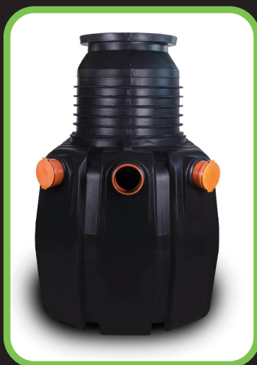
VÄNERN Medium med tre valbara ingångar

Godkända Avlopps slamavskiljare finns i två olika utföranden medium och låg, från 2000liter till 5000liter som standart, större byggs på beställning.