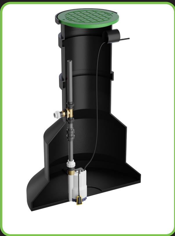
Kilformad tank som "fastnar" i marken