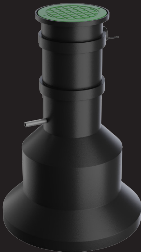
Unik design Finns i 155cm och 190cm höjd

Den kilformade botten gör förutom en stor pumpsump att den minimerar risken för att den flyter upp vid högt grundvatten och dessutom gör den monteringen väldigt enkel då den står plant och still vid återfyllningen av gropen, man klarar det lätt även om man är ensam i grävmaskinen.